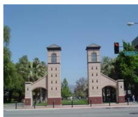
サンノゼ州立大学