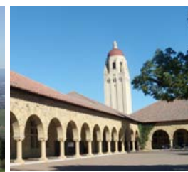
スタンフォード大学